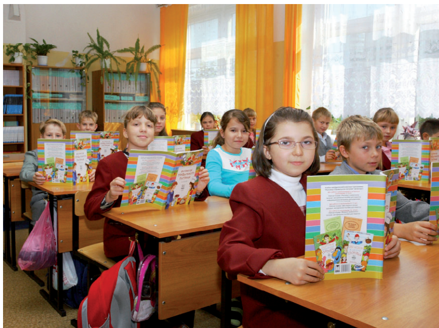
Занятия по программе «Разговор о правильном питании» в школе № 1039 г. Москвы. За десять лет в программе приняли участие 3 млн школьников, инвестиции компании «Нестле Россия» в программу составили более 150 млн. рублей. Российская программа «Нестле» послужила эталоном при подготовке глобальной программы компании «Здоровые дети», запущенной в 2009 году.

■ НК: Программа и повестка обычно разделены по тем трём направлениям, которые являют-